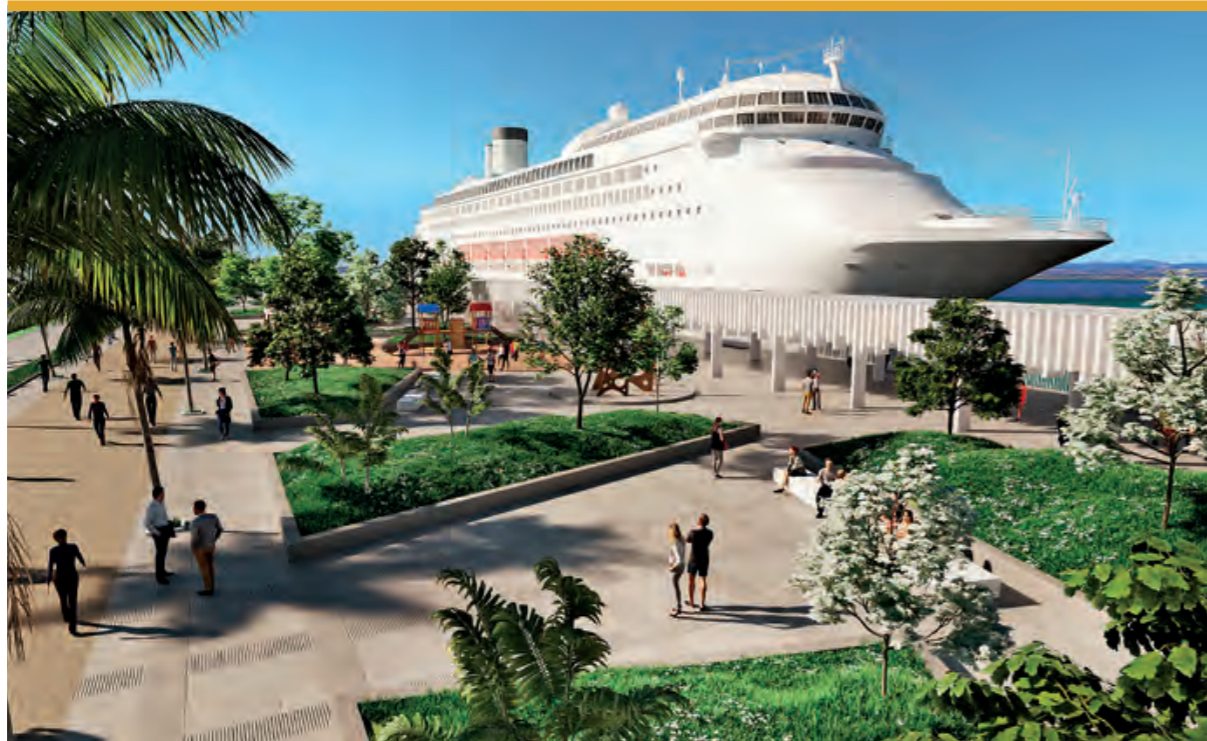
Recreación del espacio tras la ordenación del muelle Ciudad.