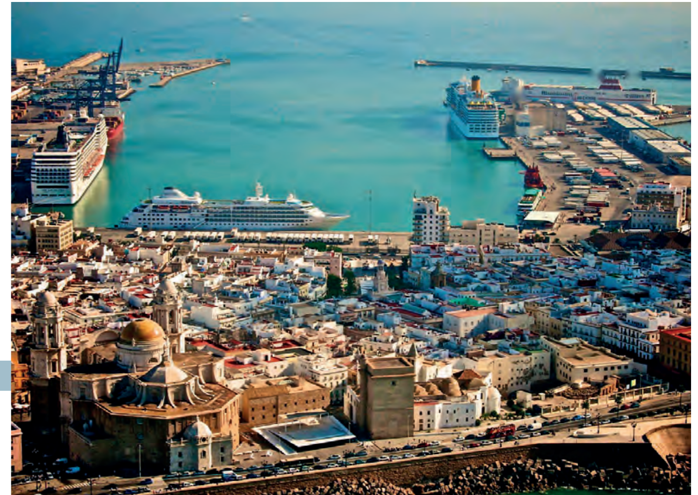
La APBC trabaja en acciones de integración puerto y ciudad en todos los términos municipales en los que se encuentra (Cádiz, Puerto Real y El Puerto de Santa María).

Tanto el Ayuntamiento como el Puerto tienen claro que este proyecto, que abarca una superficie de 243.000 metros cuadrados, es una prioridad para hacer de Cartagena una ciudad más abierta al mar y más moderna, incorporando la fachada marítima y su entorno al día a día de los cartageneros y convertirla en un espacio atractivo para los turistas.