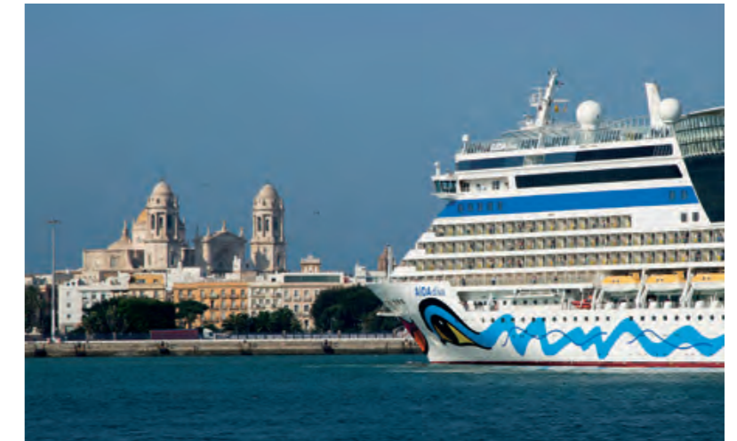
El nuevo Muelle Ciudad de Cádiz albergará la zona de cruceros y espacios ajardinados abiertos a la ciudadanía.

El Plan Especial plantea un espacio de 335.000 metros cuadrados destinado a albergar actividades englobadas en la relación puerto-ciudad, sustentada principalmente en el tráfico de crucero, complementadas con el desarrollo de actividades adicionales, tanto portuarias como no portuarias, en sus explanadas. El 45% de este espacio, unos 149.000 metros cuadrados, se destinan a espacios libres, zonas ajardinadas y viales, a los que hay que sumar otros 34.000 metros cuadrados de espacios libres en las pastillas con edificabilidad. Además, el Plan Especial promoverá el uso de energías renovables y limpias, y fomentará la eficiencia, definiendo programas específicos de ahorro energético inteligente en las nuevas instalaciones y edificaciones a proyectar.