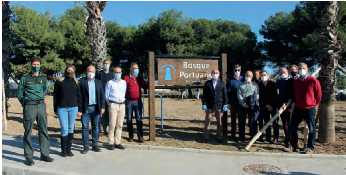
← El bosque portuario es una de las iniciativas enmarcadas en el proyecto "Málaga, Puerto Verde".