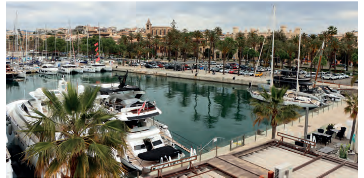
→ La Autoridad Portuaria de Baleares adaptará sus instalaciones para mejorar el medio ambiente.

ria, en un proyecto que permitirá que la energía generada por esta instalación revierta a la red de Autoridad Portuaria, a fin de ser utilizada según las necesidades de demanda en las instalaciones portuarias.