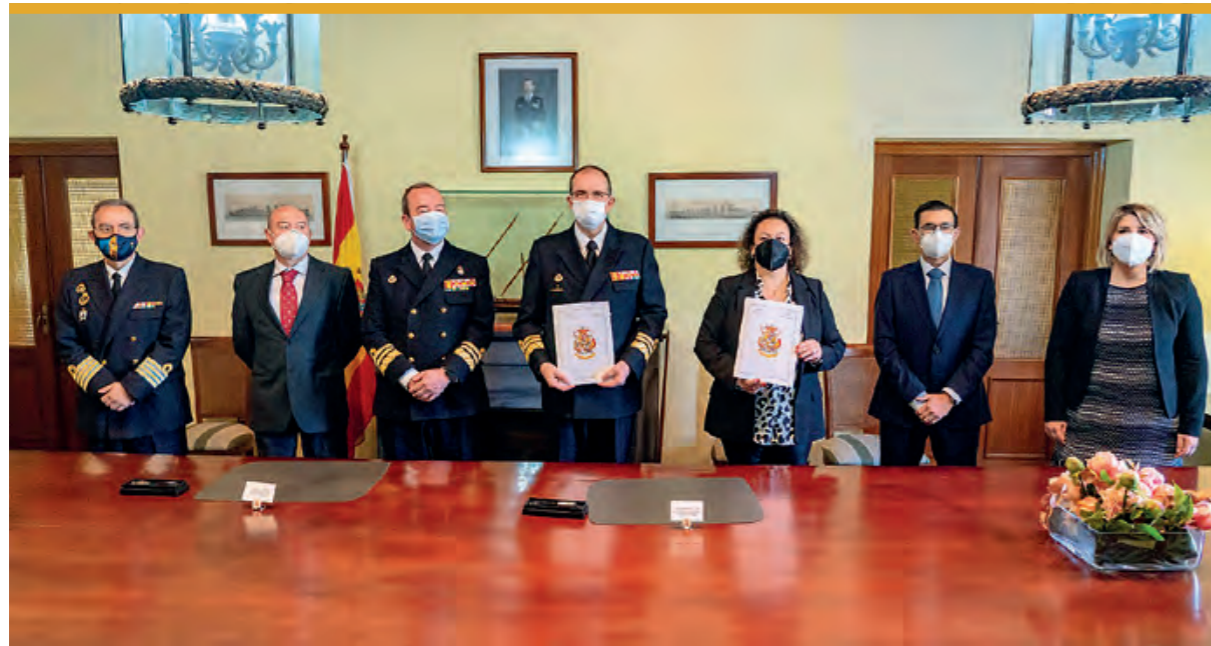
La Autoridad Portuaria de Cartagena y el Ministerio de Defensa firman el convenio de El Espalmador y Muelle del Carbón.