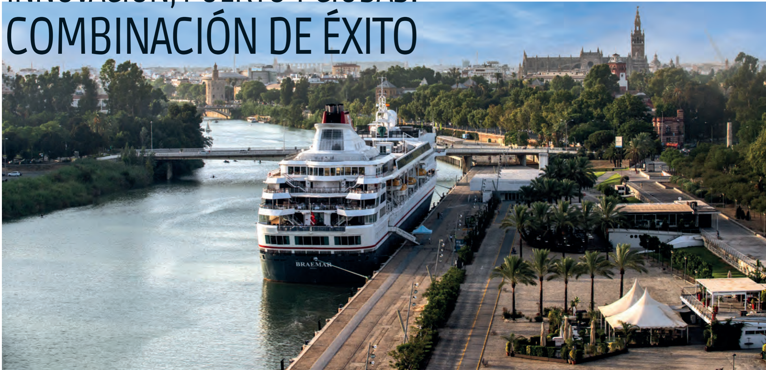
← La Autoridad Portuaria de Sevilla impulsa actualmente su Distrito Urbano Portuario de Sevilla.

nuevo que da la bienvenida a la ciudad en un área que solía ser puramente portuaria. Asimismo, trabajan para convertirse en referentes de la digitalización de la actividad y en centros neurálgicos de innovación en línea con la ciberseguridad y la eficiencia. Una especie de mini ciudad tecnológica integrada dentro del municipio con el concepto Puerto y Ciudad en el centro la estrategia portuaria.